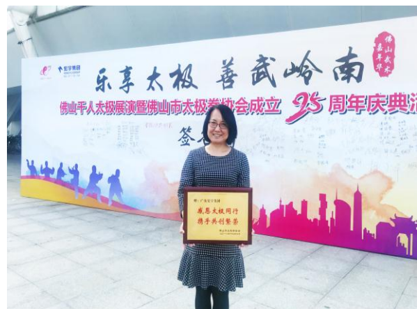
赞助佛山千人太极展演暨佛山市太极拳协会成立25周年庆典活动