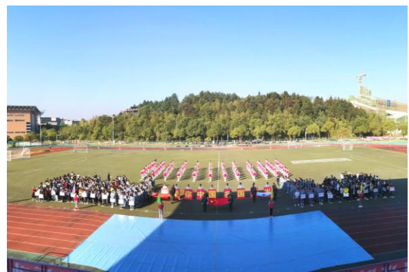
赞助景德镇陶瓷大学材料学院运动会