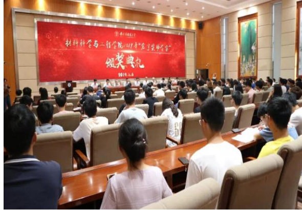
景德镇陶瓷大学设立奖助学金及体育基金，支持教育事业