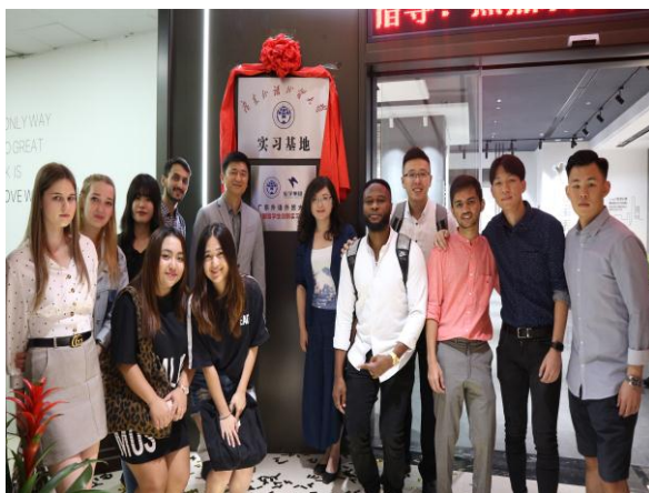
广东外语外贸大学外国留学生创新实习基地落户集团国贸部